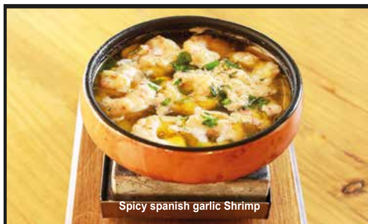
Spicy spanish garlic Shrimp