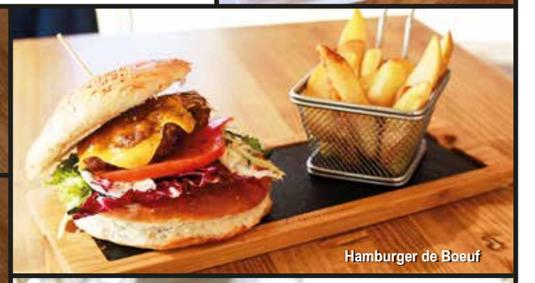
Hamburger de Boeuf