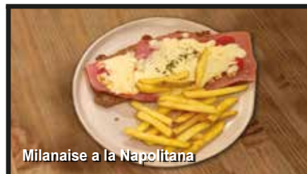
Milanaise a la Napolitana