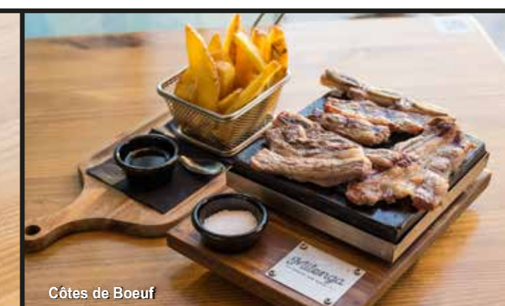
Côte de Boeuf