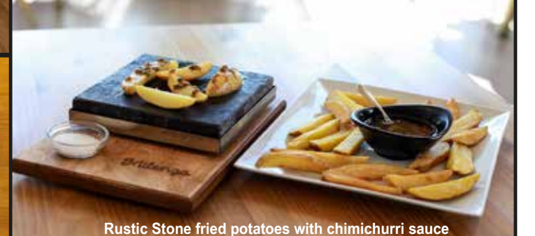
Rustic Stone fried potatoes with chimichurri sauce