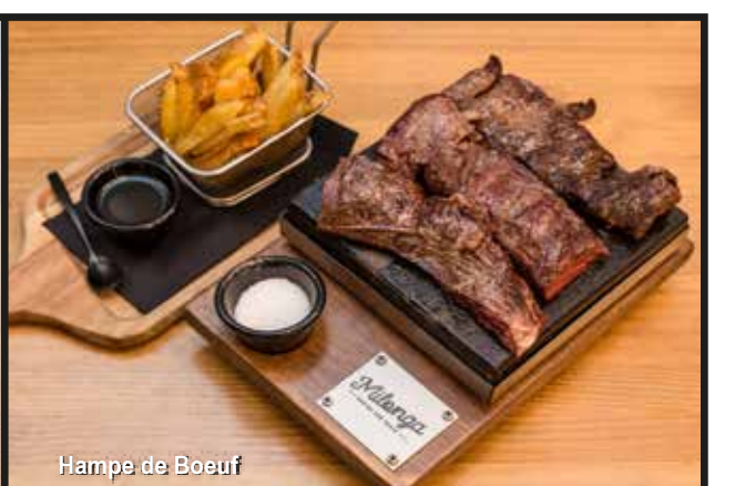
Hamp de Boeuf