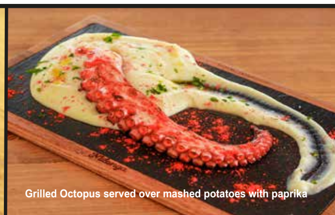
Grilled Octopus served over mashed potatoes with paprika