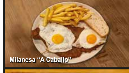
Milanesa "A Caballo"