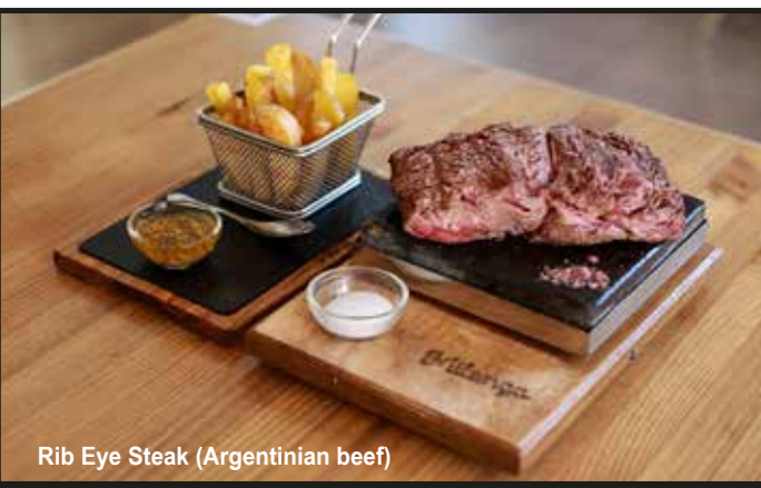
Rib Eye Steak (Argentinian beef)