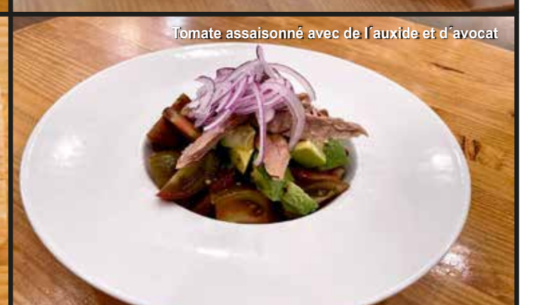
Tomate assaisonné avec de l'auxide et d'avocat