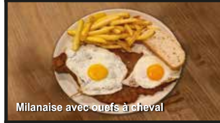
Milanaise avec oeufs à cheval