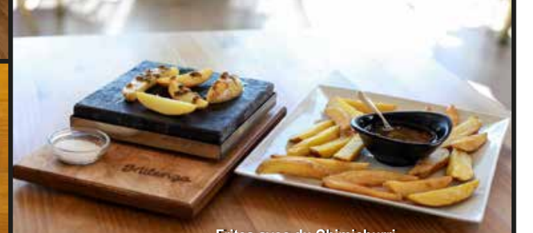
Frites avec du Chimichurri