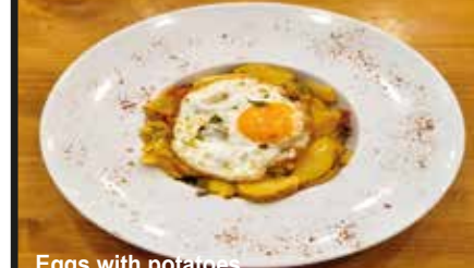
Eggs with potatoes