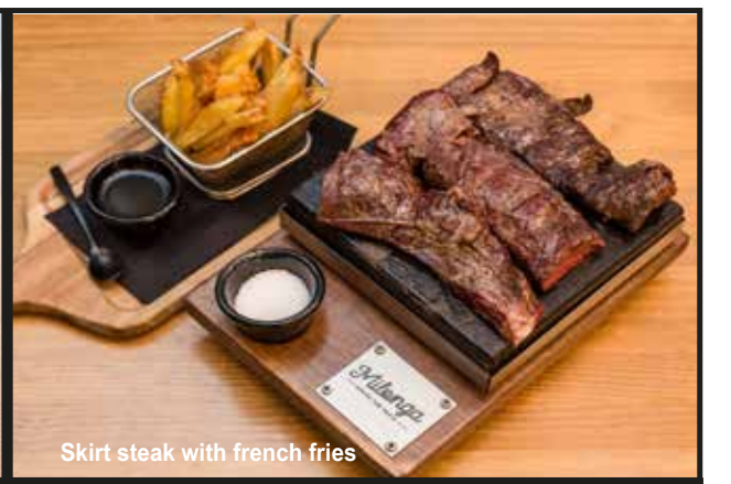
Skirt steak with french fries