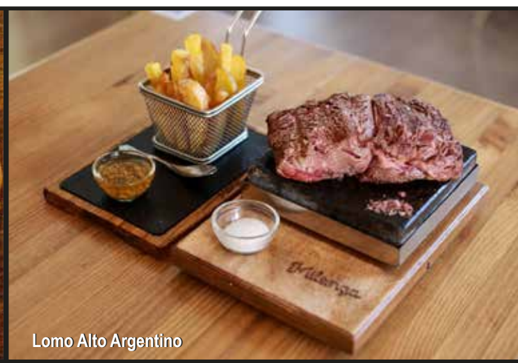
Lomo Alto Argentino