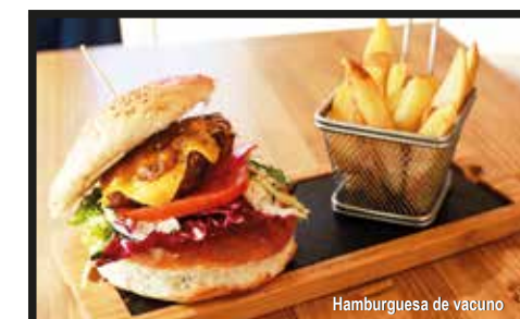
Hamburguesa de vacuno