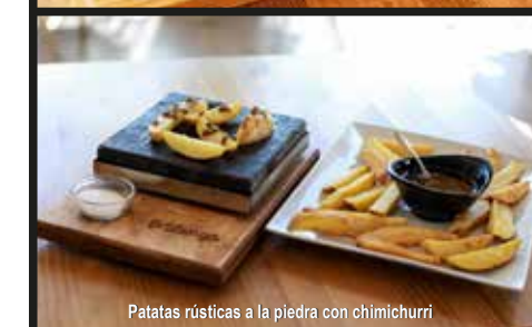
Patatas rústicas a la piedra con chimichurri