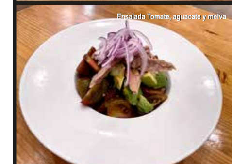
Ensalada Tomate, aguacate y melva