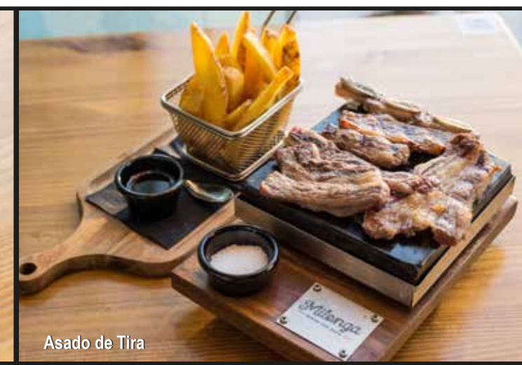
Asado de Tira