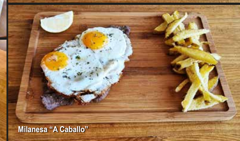
Milanesa "A Caballo"